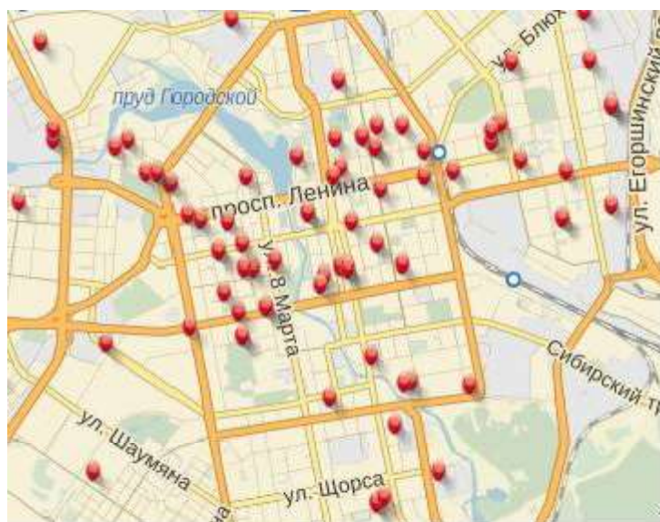
Рис. 1. Аудиторские компании в г. Екатеринбурге

Обоснование спроса на аудиторские и бухгалтерские услуги можно дать по данным портала «Деловой квартал»[]: